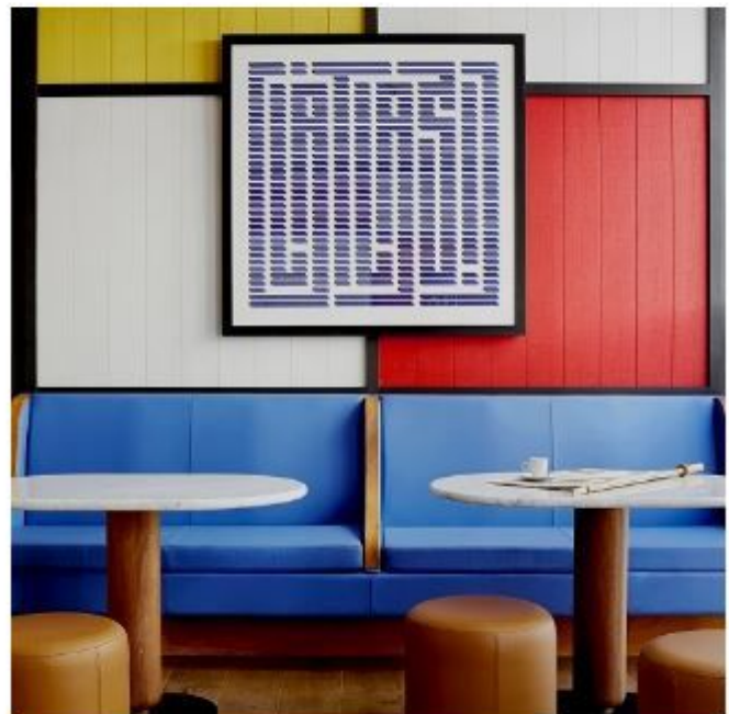
Des coins lounges colorés

Vous avez besoin de faire une présentation à vos partenaires dans un lieu de standing ? L'hôtel du Ministère propose une salle de réunion: l'Atrium. Oubliez les salles sombres et inesthétiques. Vous découvrirez un lieu de travail avec lumière naturelle et entièrement équipé avec rétroprojecteur, wifi et télévision à écran plat .