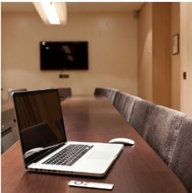
Une salle de réunion toute équipée